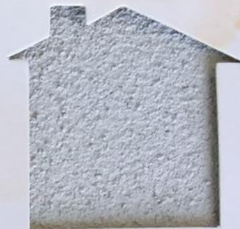
T 159/RI 327