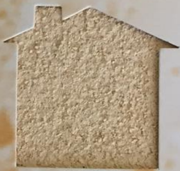
T 20/RI 337