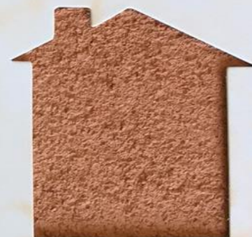
T 120/TUC 148