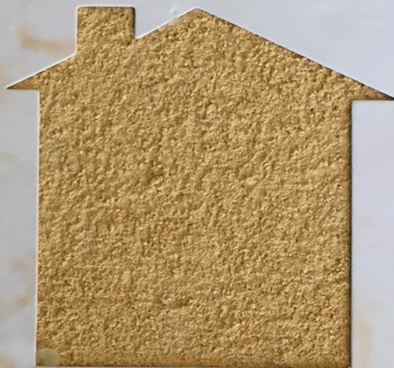
T 27/TUC 115