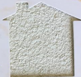
T 144/TUC 193