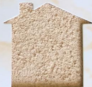
T 61/RI 345