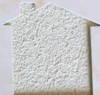
T 140/PO 803