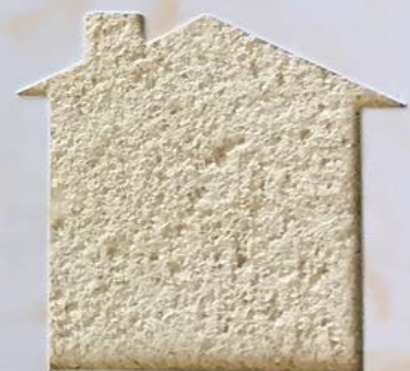
T 10/TUC 111