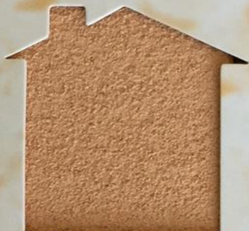
T 116/RI 344