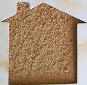
T 26/RI 306