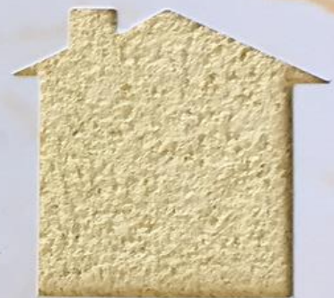
T 16/TUC 114