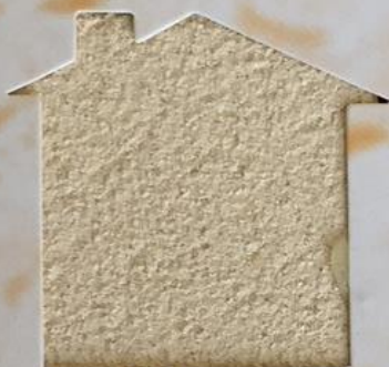
T 109/RI 335