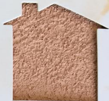
T 67/TUC 150