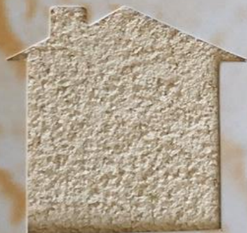
T 44/TUC 121