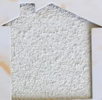
T 142/RI 329