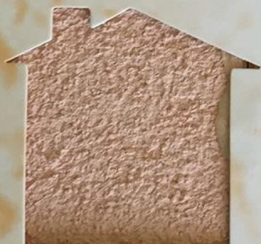
T 59/RI 341