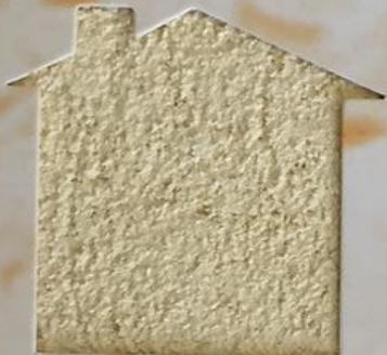
T 15/TUC 107