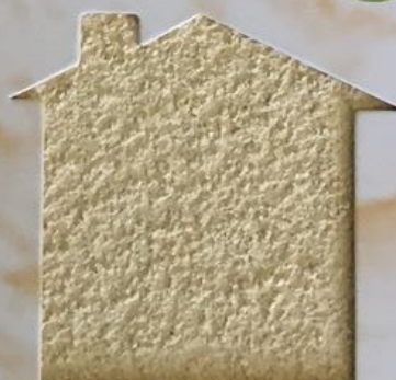
T 100/PO 801