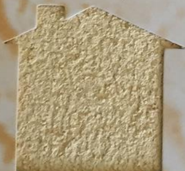
T 107/ANT 1005