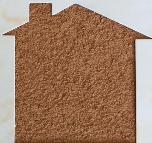
T 119/TUC 154