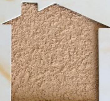
T 66/ANT 1007