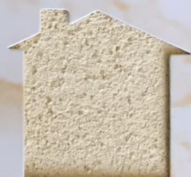
T 11/TUC 106