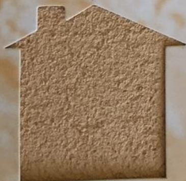
T 25/TUC 134