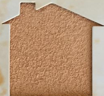
T 68/PO 806