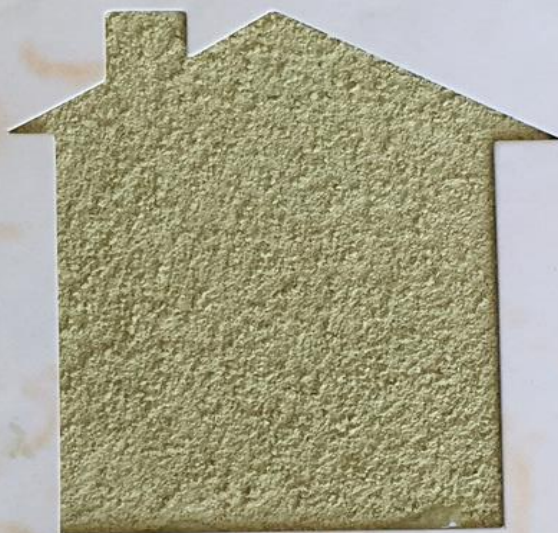
T 185/TUC 174