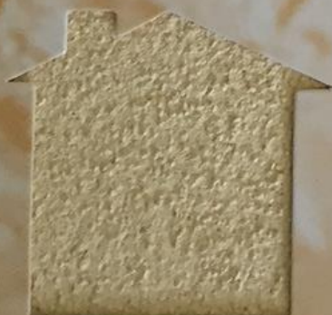
T 18/TUC 104