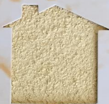
T 17/RI 303