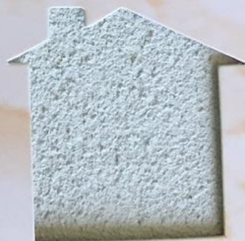
T 169/TUC 197