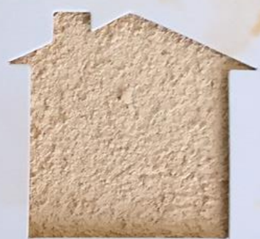
T 19/TUC 118