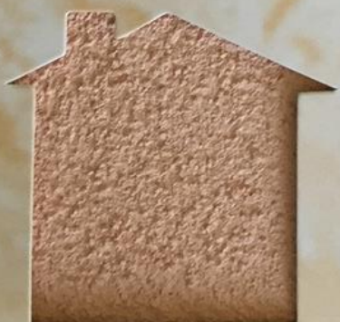
T 62/TUC 147