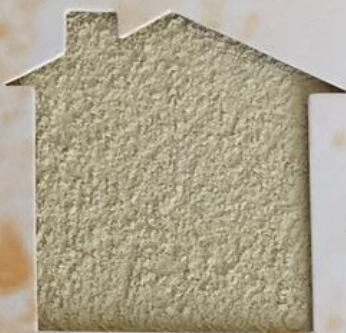
T 180/RI 338