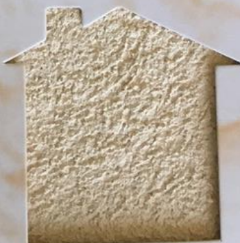
T 99/TUC 129