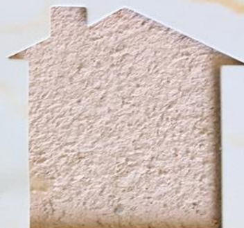
T 51/ANT 1021